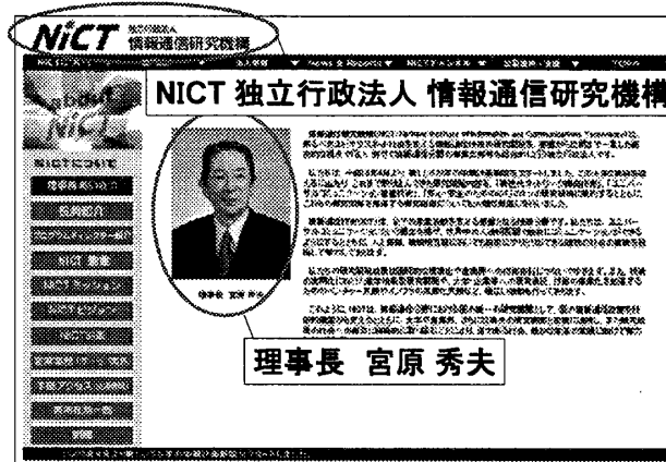
図 1: Web ページの情報発信者。

Web ページの情報発信者とは、Web ページに含まれる情報の内容、およびその公開について責任を有する個人や団体などの実体を意味する。情報発信者には Web ページの著者、Web ページを公開する Web サイトの運営者 (サイト運営者)、Web ページの中で引用された情報の著者などが含まれる。例えば、図 1 に示した Web ページには 2 つの情報発信者がある。1 つはサイト運営者である「NICT 独立行政法人情報通信研究機構」であり、もう 1 つは Web ページ