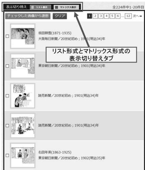
図5 「髪型」の検索結果一覧

検索結果の一覧表示機能について説明する。図5は「項目から探す」の検索パネルから「髪型」で検索した結果である。全文検索により、条件の一致した身装画像の一覧が表示されており、画像のサムネールを選択することで、それぞれの身装画像の詳細を閲覧することができる。画像が主体のデータベースであることから、一覧の表示レイアウトも二種類用意した。基本項目を確認できるリスト形式と、画像中心のマトリックス形式である。画面上部のタブにより、切り替えが可能である。なお、切り替え処理はブラウザ側で行うよう工夫されており、検索バックエンドでの再検索は発生しない。