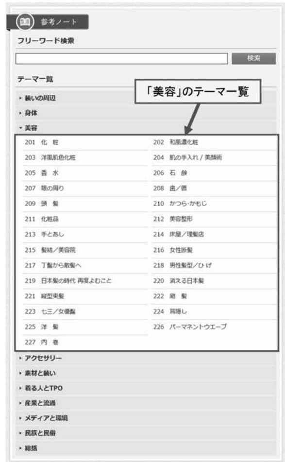
図8「参考ノート」テーマ一覧

さらに参考ノートの読みものとしての性質を活かすため、記事本文のレイアウト修正が可能な編集環境も用意している。具体的には記事テキストをレイアウト込みのHTML形式で保存管理している。記事は現在のところテキストのみであるが、今後、内容に即した身装画像の挿入や、関連情報へのリンクが整備される見込みがある。そのような要望に対し、管理用のウェブサイトから直接HTMLを編集することで、記事中への関連リンクや画像の貼り込みを自由に行うことができるよう配慮している。