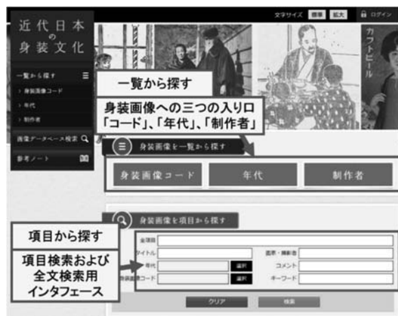
図1「近代日本の身装文化」トップページ

ェブサイト「近代日本の身装文化」を開発した。ウェブサイトの名称は、本サイトが近代日本に時期を絞った身装画像を発信対象としていることを示しており、データベースの第一の特徴に対応している。本サイトは、身装画像データベースへのアクセスとして、大きく二つのカテゴリを設けている。「一覧から探す」と、「項目から探す—画像データベース検索」である(図1)。