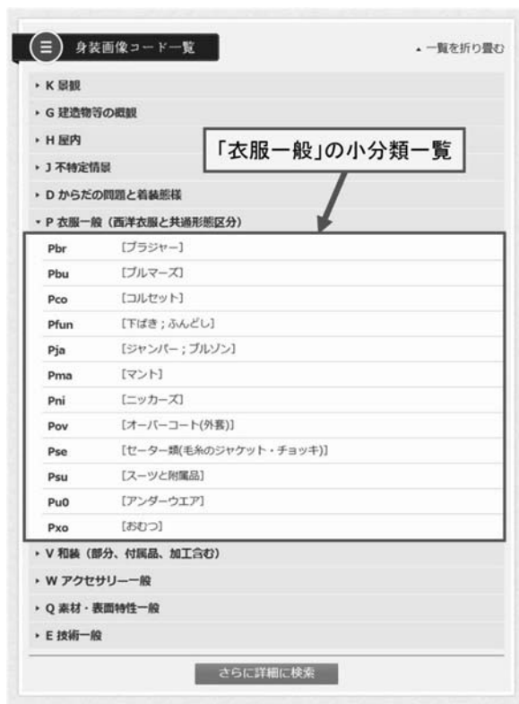
図2 身装画像コード一覧

図2は身装画像コード表の一覧表示例である。身装画像コードの大分類のうち「P. 衣服一般」を展開したところであり、12の小分類が表示されている。利用者は分類名を選択（クリック）することによって、その分類が付与されている全ての身装画像にアクセスすることができる。また小分類の選択によって検索結果が0件となることのないよう、小分類の表示にあたっては、公開対象となる身装画像が1件以上存在するコードのみを掲出するように配慮している。