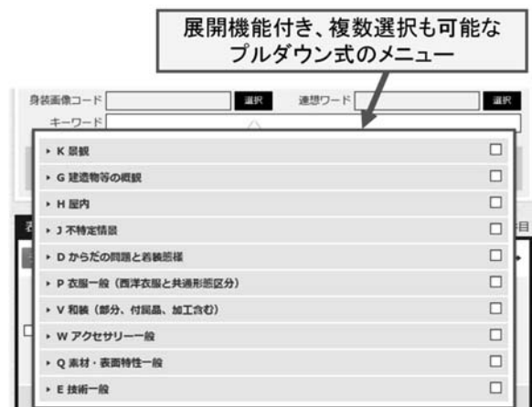
図4 プルダウンによる検索条件指定

そこで検索パネルでは、タイトル、コメント、キーワードに加えて、「身装画像コード」、「年代」、「制作者」を絞り込み条件として設定できるようにした。そのためこのうち「身装画像コード」と「年代」については、「一覧から探す」の機能を一部継承し、一覧から検索語を複数選べるプルダウン式のインタフェースを実装している（図4）。