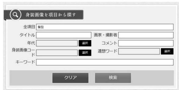
図3 「身装画像を項目から探す」検索パネル

身装画像には、タイトルなどの基本情報の他に、研究者による文章形式のコメントが付与されている。コメントは200字程度の長さでまとめられており、身装画像そのものの解説や関連する時代背景などが適切な専門用語によって語られている。そこで「項目から探す—画像データベース検索」においては、これらの豊富な記述内容にすばやくアクセスできるように、検索インタフェースの一番上に全文検索のための「全項目」という検索窓を設けている（図3）。