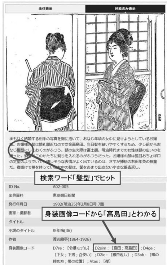
図6 検索例 (東京朝日新聞 1902 (明治 35) 年 2月 8日号 7面、右田年英 (1863-1925) 筆)

また身装画像に新聞挿絵が多いことに配慮し、文字部分を含めた新聞記事の全体画像とともに、挿絵部分のみをトリミングした画像を、タブの切り替えで閲覧できるインターフェースを用意した。またそれぞれの画像は拡大表示も可能であり、利用者の閲覧環境にあわせたサイズで画像の詳細を確認することができるよう配慮している。さらに検索結果を一覧に戻らずに確認できるよう、次の画像に進む、あるいは前の画像に戻るためのボタンを備えている。