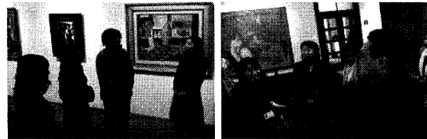
(a) 視線配布による選択法

まず、実際の美術館において、学芸員が複数の観客に対してどのような行動をするのかを観察した。我々は大原美術館 (倉敷) で美術の専門家である学芸員が絵画作品について解説を行う場面 (学芸員 1 人、観客 3 人) を撮影し、特に質問行動の場面に注目し、分析した。図 1 は、学芸員が観客に対して、解説している場面である。観客が複数いる場合は、学芸員はすべての観客に視線配布を行い、観客の視線を集め、注意を引きつけている。そして、観客の視線変化を観察し、明らかに視線を外した観客ではなく、自分に視線を向け続けている観客を選び、質問をしていた。この話し手の視線の向け方を「視線配布による選択法」と呼ぶ。