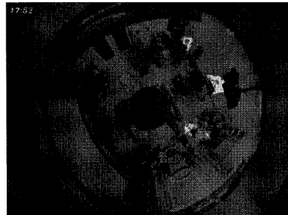
図 1: Space Aware Vision

我々は、SAV において緑色で表現していた変化のあった領域に、更に「その領域に最後に画像の変化があった時点からの経過時間」の情報を加える事によって、より詳細な過去の状況を伝えるライブカメラ映像を実現できると考えた。SAV の映像において、6 時間前から 5 時間前まで変化があった領域と、1 時間 5 分前から 5 分前まで変化のあった領域は、同じ明度の緑色で表現されるが、その変化の示す意味は大きく異なる。「5 時間前に変化があってから変化のない領域」で動いていた人物はその場から離れて遠い場所に行っている可能性