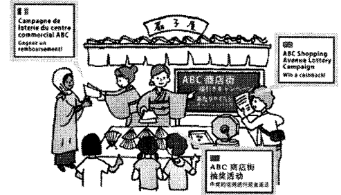
(b) ドキュメント型：商店街のちらしの翻訳 図2 多言語コミュニティ環境展開イメージ図

さらに、質問応答機能を用いても足りない場合には、コンテンツベースの多言語掲示板を用い、母国語を用いたコミュニケーションを行うことで、補うことを想定している。