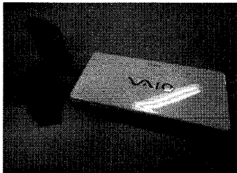
図 1 携帯型情報投影システムの構成

情報提示プロセスは位置情報をキーにデータベースから取得した出力情報を携帯プロジェクタから出力する。今回のプロトタイプシステムでは位置情報とリンクされたデータファイルを取得し、そのファイルの内容を出力表示している。この際、データへのアクセスには HTTP のプロトコルを用いており、ネットワーク上から必要なデータファイルを受け取り、出力する形態となっている。