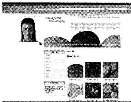
図 2 システムのスクリーンショット

Integrator でキーボードからの入力と統合される。その後、統合結果は XISL Interpreter に送られ、シナリオ記述言語 XISL の記述に従い出力内容が生成される。出力内容がエージェントの場合、Agent Manager が顔画像合成器 Galatea FSM と音声合成器 Galatea Talk の出力を用いてエージェント動画像を生成し、ブラウザ上の Agent Presenter に動画を配信することでエージェントから応答が返される。