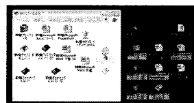
(b) 仮想世界での GUI 操作