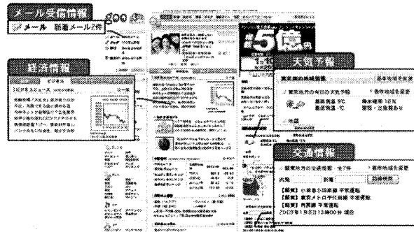
図. 1 ポータルサイト goo の例 (2009. 1. 9)