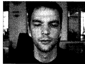
図 2 BioID 顔 DB 内の画像例

素材として、BioID 顔データベース[6]内の顔画像(図 2 に示す)と Web 上から人間の映っていない画像を用意した。そして、これらの画像に加工を行い、顔画像・非顔画像のサンプルを作製した。なお、サンプルの一部を図 3 に示す。