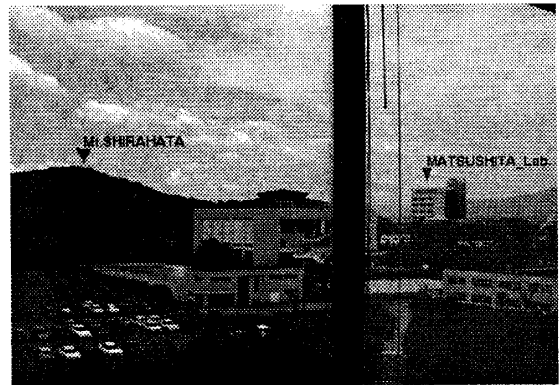
図 3: 実行中の表示画面

試作したシステムで動作実験を行った。実行中のディスプレイの表示画面を図 3 に示す。実際の山と建物の上に、その名称が表示されている。これらの案内表示は、カメラの動きに追従して常に実際の対象物の上に表示される。