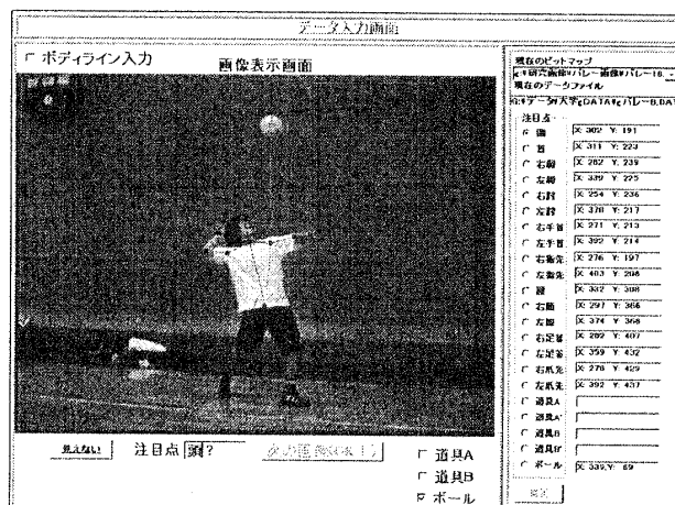
図1 データ取得画面

本アプリケーションは、運動者の身体の末端部分と関節部分を注目点として、この部分の座標データを取得するインターフェイスを備えている。座標取得にはマウスを使用し、ここでも特殊な機器は使用しない。マウスでのデータ取得方法は解析画面上でマウスをクリックすることにより次の作業の指示が表示されるのでユーザは指示通りに作業を行えば良い。これによりコンピュータに詳しくないユーザでも簡単にデータ取得ができる。本アプリケーションのデータ取得画面を図1に示す。