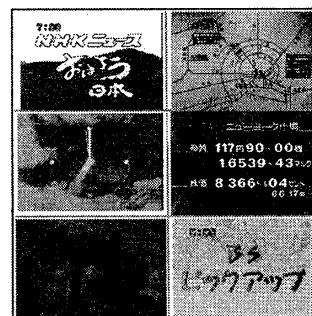
図 1: Some examples of "feature frame" representing special meaning.

要がある.このため,本システムではまず,このようなコンテンツに関するいくつかのフレームを選んで,"特徴フレーム"データベースを作る.そして,"wavelet transform"モデル[2]を用いて構築されたデータベースのビジョンインデックスに基づいて,"特徴フレーム"を検出する.