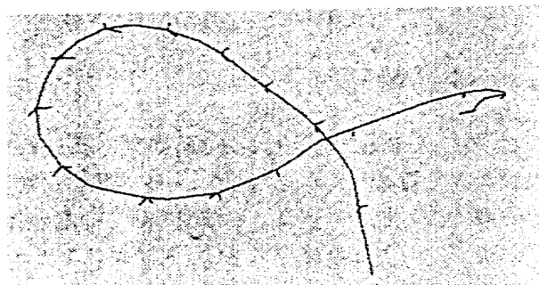
a) 原データ(56点)と分割点(17点)

速度変化による分割点: 始点終点および速度の極大極小点などの特徴点を分割点とする。