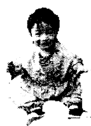
図4. 本手法による結果