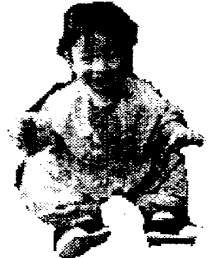
図5. 従来手法による結果