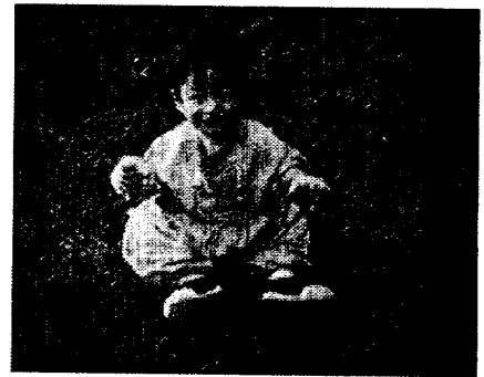
図3. 原画と初期輪郭

また、髪の毛と暗い背景のように輪郭付近に輝度の変化があまりみられない領域も、本手法では色による領域分割結果を利用しているため、あまり違和感のない輪郭線が抽出されている。