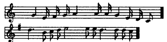
図1 「きょうの日はさようなら」の例

表中の「音高が似ている」こと具体例の一つとして図1に「きょうの日はさようなら」の場合を示す。図1の楽譜は上段が被験者の入力による音符列で、下段がデータベース上の音符列である。まず、二つの音符列の最初の音高差を補正するように移調すると、音高変化が一致する(図2)。また、どちらか一方の時間の縮尺を変えると、数個の音符を除き、音価がほぼ一致する。