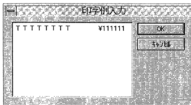
図 2: 印字例入力画面

フォーマットテーブルは、図3の左側の部分である。その構成は [Byte][Type][Place][Figure][Character] の順に並んでおり、その設定内容が異なると右側の印字例表示も異なる。Byte は文字の大きさを表わし、Type は3.1節の編集タイプテーブルのタイプである。Place は印字する位置の基準点を表わし、文字は左づめ数字は右づめに設定されている。Figure は印字文字の長さを表わし、Character は付属文字を表わす。付属文字は¥・$等の文字である。このテーブルの役割は、次の章で説明するテーブル入力と印字例入力に使用される。