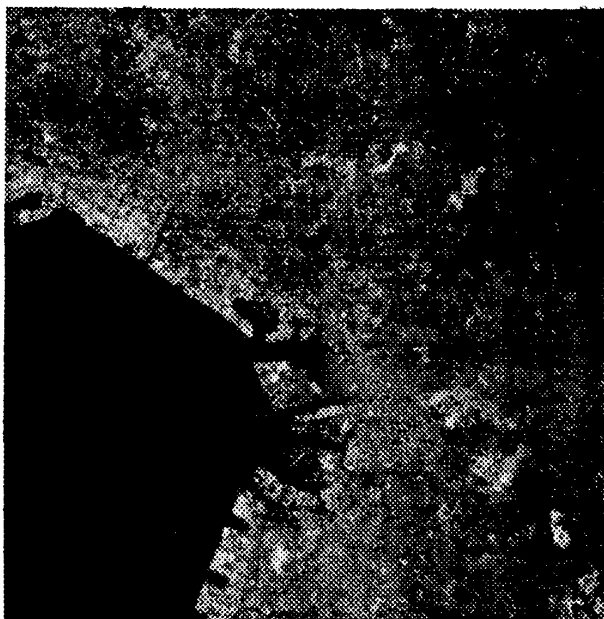
図1 1988年の千葉市のフォールスカラー画像