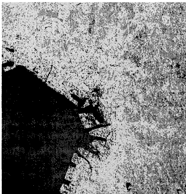
図3 Nsv値を8等分して被覆分類した画像

しかしこの方法ではNsv値を決定するために人間が判断をしなければならない。そこでNsv値を8等分、つまり0.125ずつに区切って被覆分類をした画像が図3である。図2と比較しても、図1のフォールスカラー画像の特徴が表されているといえる。その他の画像