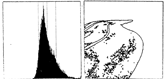
図3. 道のヒストグラム

基本的には 3.1, 3.2 の処理を繰り返す。唯一異なる点として、ネットワークの入力にテクスチャ性を加えることである。図3に対する最終結果を図8に示す。