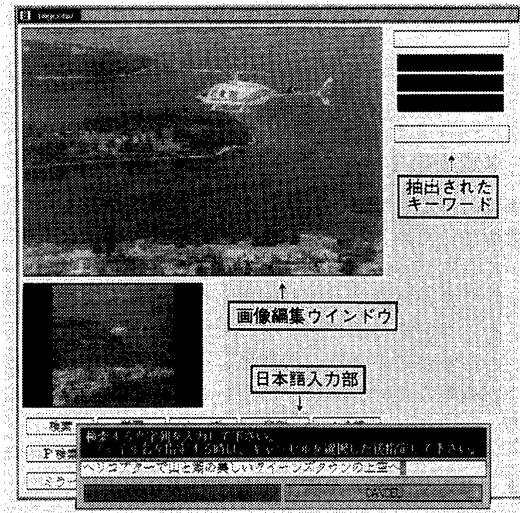
図2: 文からの画像部品の検索例

なお各画像の評価値は簡単に、検索属性と画像の属性値が一致した場合には+1、異なる場合には-1、とし、この値をすべての検索属性について合計したものとする。