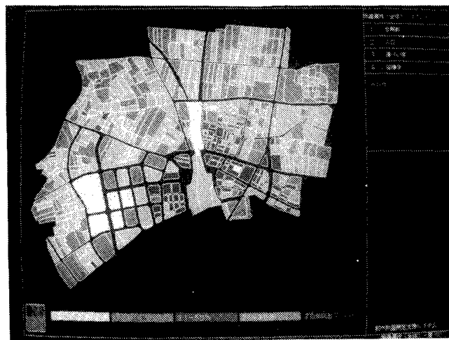
図3 地番属性の検索例(建ぺい率)