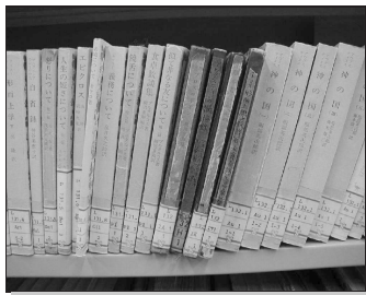
図 1 廃れた書物 Fig. 1 Old books.