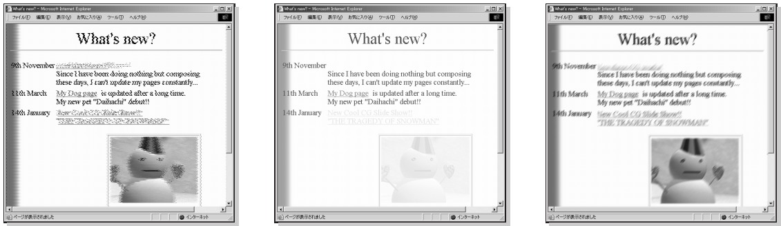
図 4 視覚化効果の適用例—捻れる・色あせる・にじむ Fig. 4 Examples of distortion, fade, and blur effects.

集等の長いリストから新鮮な情報を発見するのに役立つ．実際に，本システムを通して研究室ページのメンバの一覧を見ると，ページを更新している学生と，そうでない学生が一目瞭然であった．