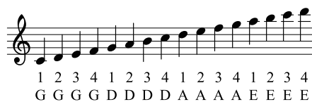
図1 第3ポジションにおける音高に対する弦と指

ポジションは、指番号1(人差し指)の位置の音と開放音の音程が2度の時は第1ポジション、3度のときは第2ポジション、4度のときは第3ポジション、...というように定められている。ギターなどのフレット表現は半音単位であるのに対し、バイオリンのポジション表現は度単位であることに注意が必要である。各ポジションのテンプレートは、指番号1, 2の音の音程が2度、指番号1, 3の音の音程が3度、指番号1, 4の音の音程が4度、となるように定