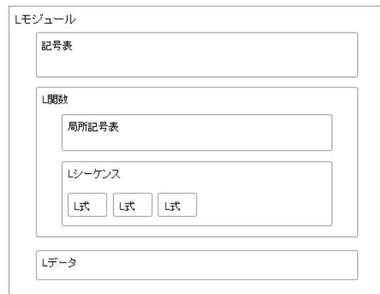
図 1 LIR の構造