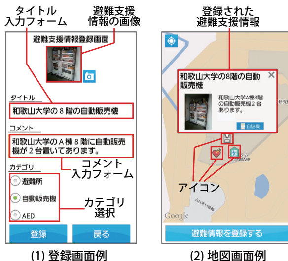
図 2: システム画面例