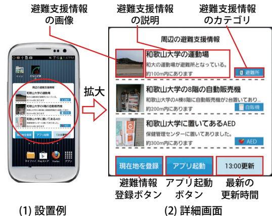
図 3: ウィジェット画面

本機能では、災害発生前のオンライン時に、利用者の位置情報を定期的にサーバに送り、それをもとにした避難支援情報を携帯端末へ保存する。これにより、外出先の知らない土地などでも、自動的に避難支援情報を受け取ることができる。