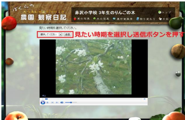
図3 成長過程別連続再生機能

せる成長過程別連続再生機能を開発した。開発した機能の画面例を図3に示す。ここで表示されるコンテンツは著者がサーバに蓄積されている約4000枚の画像の中から各成長過程に適した画像を主観的に選択し、その画像を連続再生させた動画コンテンツである。