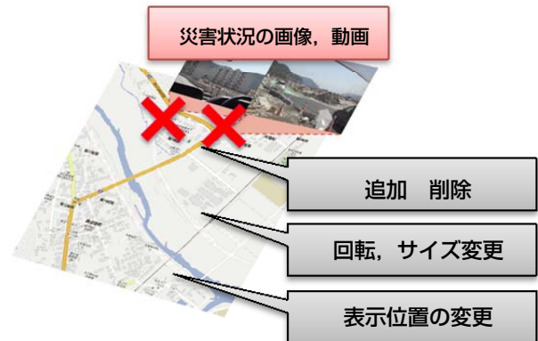
図 1. 電子地図への災害情報の追加

オブジェクトは、各拠点のユーザの操作でワークスペース上を自由に移動、拡大、縮小そして回転させることが可能で、重ね合わせの順番は変更が可能なものとしている。また、遠隔地との協働作業を行う上では、テレプレゼンスが重要となる。そのため、本システムでは協働作業相手の姿を地図情報と同時に表示することが可能な Video Voice over IP 機能を提供することにより、同一の拠点で作業しているかのようなテレプレゼンスを提供することが可能となる。