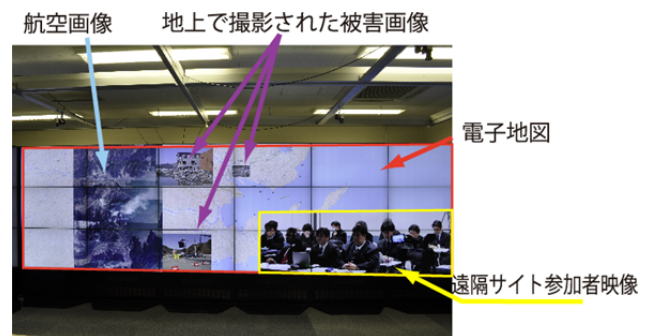
図4. システムの稼働イメージ

現在構築を行っているプロトタイプ環境では、大規模高精細表示環境に、安価でスケーラビリティの高いタイルドディスプレイシステムを利用し、表示プラットフォームとして Scalable Adaptive Graphics Environment (SAGE) 5) をベースとした環境を実装している。デジタル地図には、国土地理院の電子国土 Ver.4 の OpenLayers 版をプロトタイプとした環境の構築を行っている。図4にタイルドディスプレイ上での稼働イメージを掲げる。