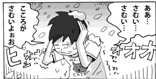
図1 マンガの視覚表現

日本のマンガは様々な特徴を持っている。例えば、会話中のキャラクターの感情や場の雰囲気を視覚化する多くのテクニックがある[5]。ここではそのテクニックのうち、文字の大小や文字変化、吹き出しやマンガで用いられている記号（漫符）、手書きやオノマトペを用いた（図1参照）。これらの技法は、教員の感情や教室の雰囲気を聴覚障害者に伝えるのに有効であると考えられる。