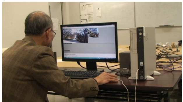
図 3 クライアントの操作の様子

実験は TravelProxy のことを全く知らない外部の被験者 1 名と、研究室の学生 4 名にクライアント役として協力を依頼した。プロキシは神奈川県横浜市のみなとみらい地区を探索し、クライアントはカメラを通して命令を送り、プロキシを操作した。以下の図 3 に実験の様子を示す。