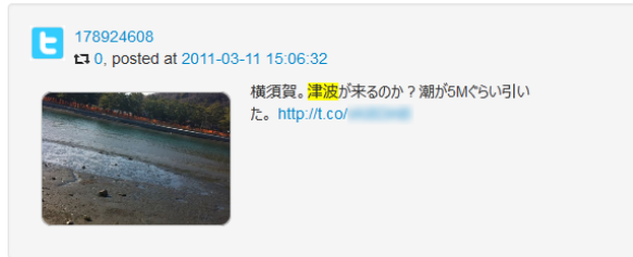
図 2: 横須賀で撮影された写真付きツイート