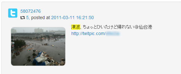
図 3: 仙台湾で撮影された写真付きツイート