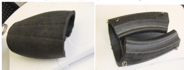
図 3-1 PRT(表)

用いていたが、本研究では、身近な環境での学習を可能にするために、高価な専用器具の代わりに廃タイヤ(図 3-1、図 3-2)を利用した。廃タイヤを切断し、半円形になるように加工した。本研究ではこれを Pressure on the Recycle Tire(PRT)と呼ぶ。胸骨圧迫時において適切な深さだとされる 5cm を再現可能とし、耐久性と安価であることを重視した模造品を作り、使用した。