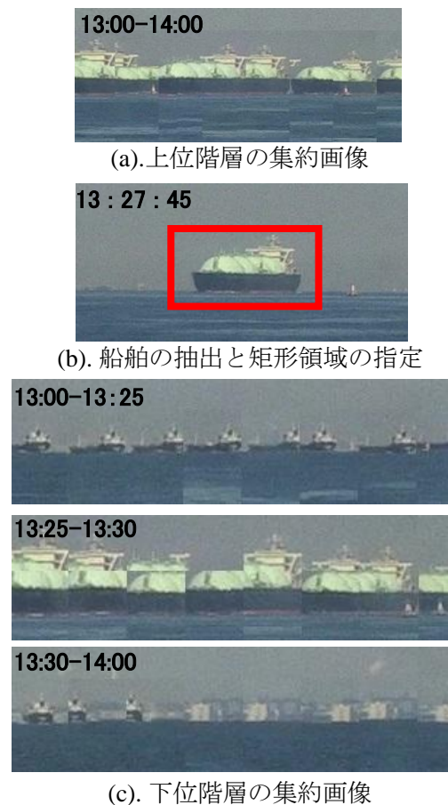
図3.船舶の出現に応じた集約画像提示