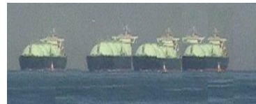
図1.集約画像作成結果

集約画像は、任意時間範囲において、時系列画像のフレーム間差分を取ることで輝度変化を求め、それが最大となるものを1枚の静止画像た部分を1枚の画像に集約することができる。に集めることで作成する。つまり、変化が生じこの手法は背景固定の環境でのみ適用が可能で