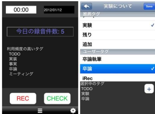
図2: iRecの録音画面(左)とタグ選択画面(右)

iRec とは、iPhone 用に開発した録音アプリケーションである。iRec の録音画面および、タグの選択画面を図2に示す。