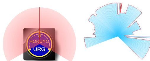
図2 計測可能範囲 図3 計測イメージ

図2はレーザーレンジファインダーが計測できる範囲、図3が計測した検出結果をイメージ化したものである。