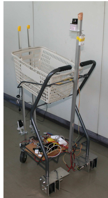
図1 自動追従ショッピングカート

図1が、実際にこれらを搭載した自動追従ショッピングカートである。また、これら装置は一般的なショッピングカートに搭載する事で動作させるため、カート形状の異なった店舗でも使用可能である。