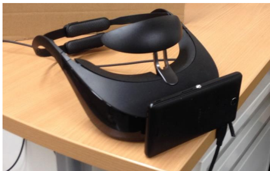
図 1 利用する HMD と Android 端末

本研究では、カメラ、GPS、演算装置が内蔵されている Android 端末をヘッドマウントディスプレイに取り付けることで、ビデオシースルー型のヘッドマウントディスプレイとして用いる(図 1)。