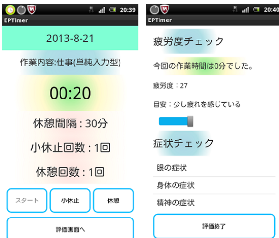
Fig.2 「休憩時間通知タイマー(Ver1.0.7)」画面

タイマーを終了させると評価画面に遷移し現在の疲労度や感じている症状が入力できる。入力が完了するとタイマーで記録された総作業時間と入力した疲労度を演算処理して休憩間隔の導出を行う。症状や導出された休憩間隔などの情報は次回利用時や他の機能にフィードバックするためデータベースに記録される。