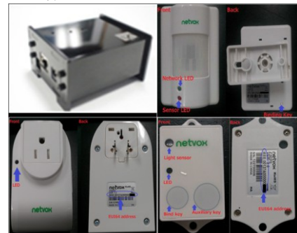
図 1 使用した機材 iNode (左上)