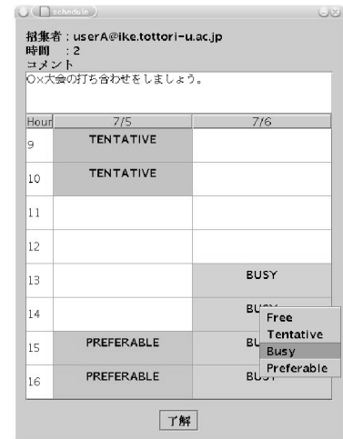
図 4 ユーザ A の予定入力画面 Fig. 4 User A inputs his schedules.

の所要時間を 2 時間とした場合を考える . ユーザ A とユーザ B は表 1 のように予定を入力したとする . preferable は会議の開催を希望する時間を表しており, ユーザ A だけが入力できる . busy は会議に参加できない時間, tentative は交渉の余地のある時間, 空白部分は会議に参加できる時間を表している . 会議の所要時間が 2 時間であり, busy と入力されている時間