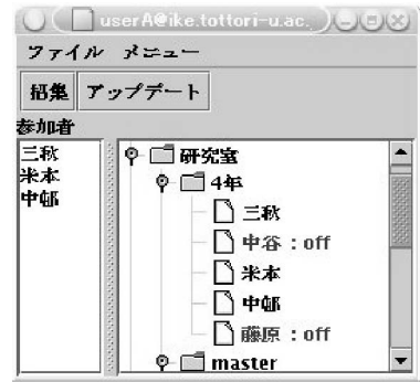
図 2 会議参加者選択画面 Fig. 2 Window for selecting the participants.

以下に実行例として, 招集者ユーザ A がユーザ B を参加者とし, 会議開催日の調整期間を 2 日, 会議