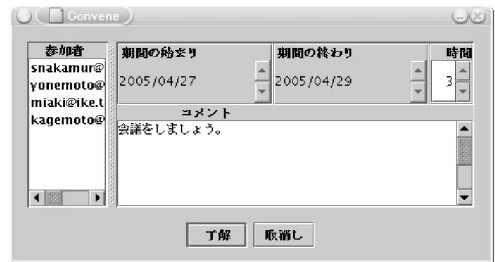
図 3 会議情報入力用ウインドウ Fig. 3 Window for input meeting information.