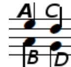
図 3 階層構造の解釈の不確定性を示す例

から発音や消音の指令を出力するモデルである．ここで，各 left-to-right のパスの中の状態数とそのパスを通り際の1拍の時間を表し，パス間の遷移確率は1拍の長さがどう変化しやすいか，つまりテンポ変動の起きやすさを表す．