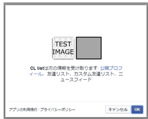
図 3 OAuth 認証による確認画面