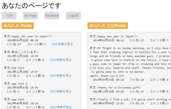
図 5 メインページ Figure 5 My page.

マイページとは、ログインユーザの投稿のみが表示されるページである。左側にユーザの投稿を新着順で表示し、右側に注目投稿順にソートしたものを表示している、また、マイページにはどのページからでも遷移可能である。これを図5に示す。