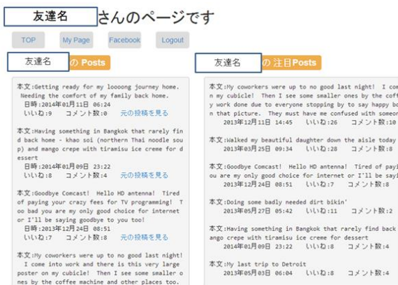
図 6 フレンドページ Figure 6 A friend page.

フレンドページとは、ユーザの友達の投稿を表示するページである。マイページと同様に左側に投稿を新着順で表示し、右側に注目投稿順にソートしたものを表示している。これを図6に示す。フレンドページにはメインページの友達一覧から、友達の名前をクリックすることにより遷移可能となっている。