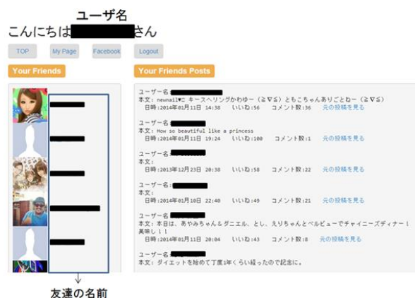
図 4 メインページ

OAuth 認証後は、まずメインページに遷移する。メインページでは、左側にログインユーザの友達情報を表示する。友達の名前をクリックすることにより、各ユーザページに遷移することが可能である。これを図 4 に示す。