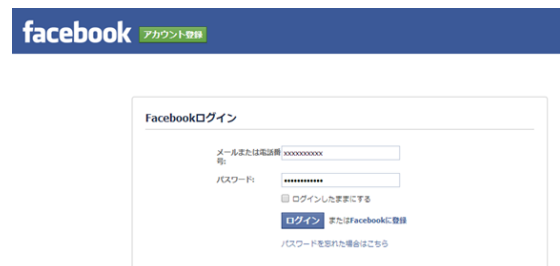
図 2 Facebook へのログイン画面

要があり、OAuth 認証を必須とする。Facebook へのログイン画面を図 2 に示し、認証画面を図 3 に示す。