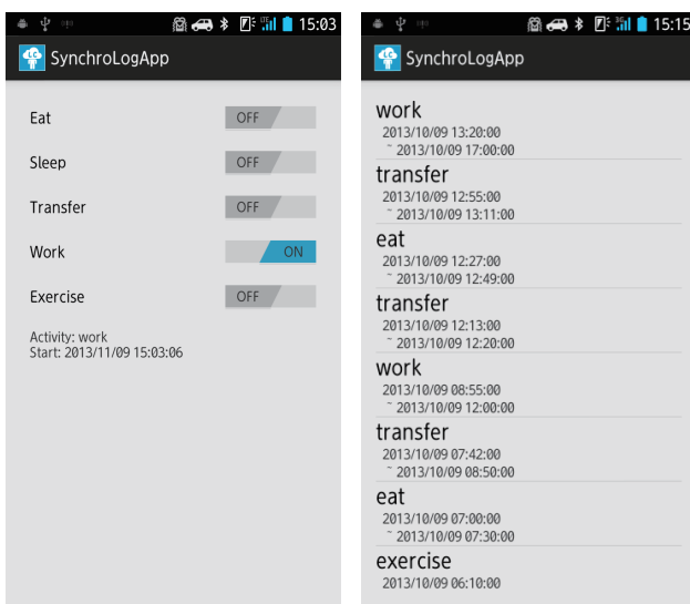
(a) 行動の記録 (b) ログビューワー