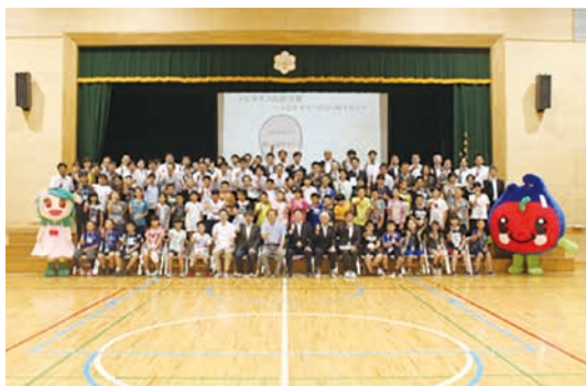
図-8 2016年度開催の様子

子供たちは、普段はあまり触れることのできないICTの最新技術を驚き、楽しんでいる(図-5, 図-6, 図-7, 図-8)。父兄や先生方も楽しんでいるようだ。