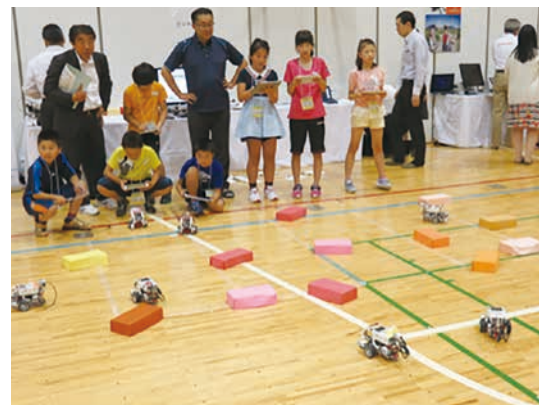
図-4 2016年度開催の様子