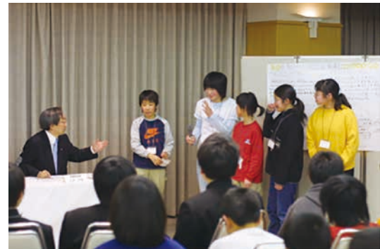
図-2 第1回目開催の様子