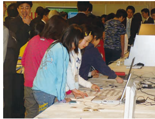
図-1 第1回目開催の様子