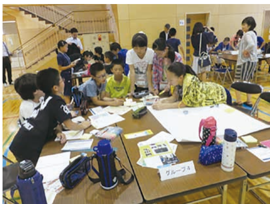
図-5 2016年度開催の様子