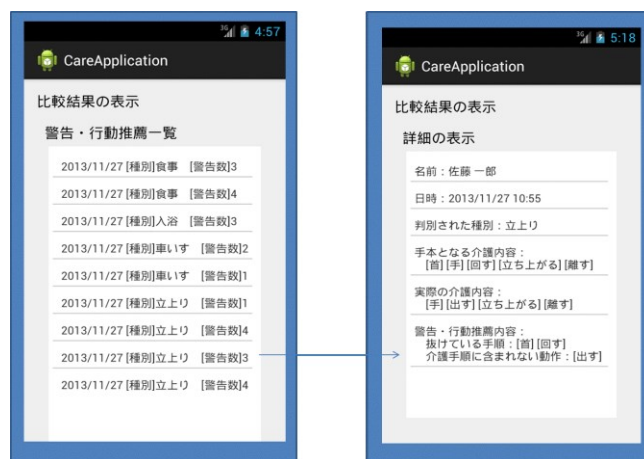
図3 警告・行動推薦結果の表示画面