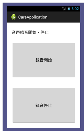
図 2 音声取得画面

本提案システムの音声取得部分では、Android 端末を利用し、音声の録音を行う。この音声の取得は声掛けを行う際、図2に示す録音開始・録音停止ボタンを操作することにより行う。