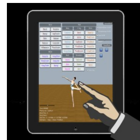
図 3 タブレット端末版 BMSS のインタフェース