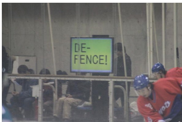
図 2 会場に設置されたディスプレイ (試合中に撮影)