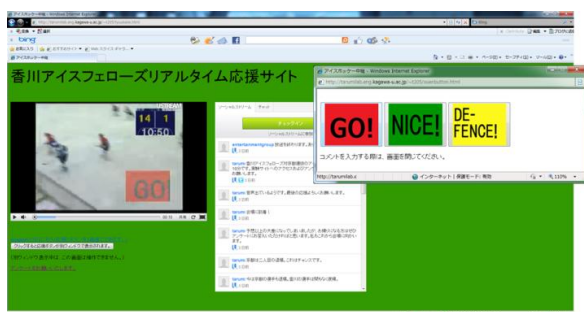
図 1 応援画面例

視聴者が利用する応援用サイトには、Ustream の映像と Ustream のコメントを表示させた。さらに、応援ボタンとして GO!, DEFFENCE!, NICE! を提供し、専用の応援サイト (図 1) で利用できるようにした。視聴者はこれらをマウスでクリックすることによって応援の意思表示をすることができる。ファンが応援ボタンをクリックすると、会場に設置された大型 (約 50 インチ) ディスプレイ (図 2) にその応援が表示される仕組みとなっている。