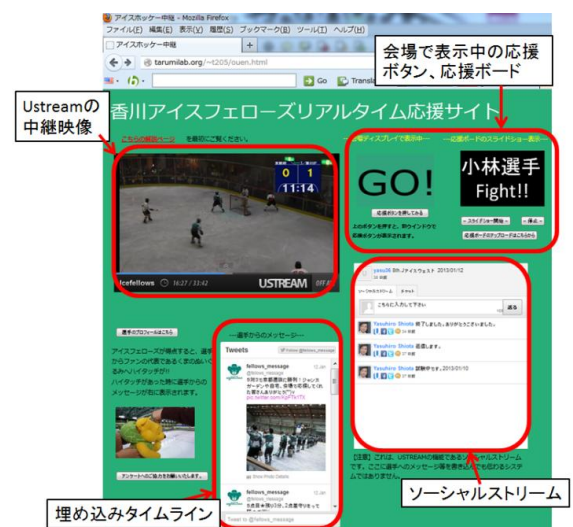
図5 Twitter も埋め込んだ専用応援サイト