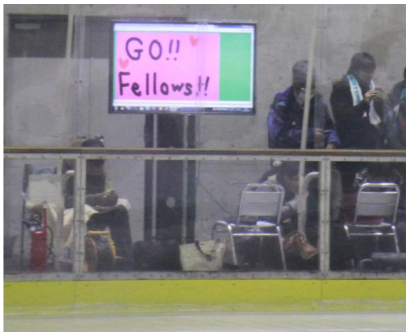
図6 試合中に実際に表示された応援ボード例

の応援ボードを作成するか、手書きの応援ボードをカメラで撮影し、専用の Web サイトもしくはメール添付により投稿することができる。ファンによって投稿された応援ボードは、試合のインターバル中に会場に設置したディスプレイにスライドショー表示される(図6)。