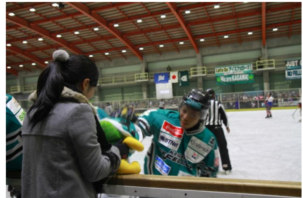
図4 得点後、ハイタッチ検知デバイスに「ハイタッチ」を行う選手(実際の試合中に撮影)

得点を取った選手がベンチ前でハイタッチを行う際、選手と一緒に並んだスタッフが持っているチームマスコットに見立てたぬいぐるみの頭部に取り付けたハイタッチ検知デバイスにもハイタッチをしてもらう(図4)。ハイタッチ検知デバイスは感圧センサーが取り付けられており、センサー値はノート PC に送信されている。ノート PC ではこれをトリガーとして、twitter 上にあらかじめ設定しておいた遠隔のファンに対するメッセージを自動的に投稿する。投