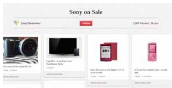
図8 Sony on Saleのページ

また、Repinに関するキャンペーンもおこなっている。ソニーのボードにSony on Saleというボードがある。この写真をユーザが一定数以上Repinしたら、画像のリンク先がキャンペーンコードのページへ変わるという仕組みだ。