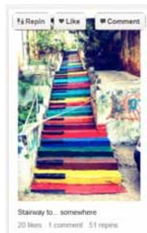
図 2 画像に Repin のボタンが表示された状態

Pinterest はコルクボードにお気に入りの写真を貼っていく感覚で、Pinterest 上の自分のページに写真をまとめることができる。自分のページをボードと呼び、ボードに写真を貼る行為を Pin と呼ぶ。そのボードに Pin する写真は、自分で撮ったものでも他のユーザが投稿したものでもかまわない。他人の写真を貼る場合は、画像に表示される Repin ボタンを押して自分のボードに Pin する。