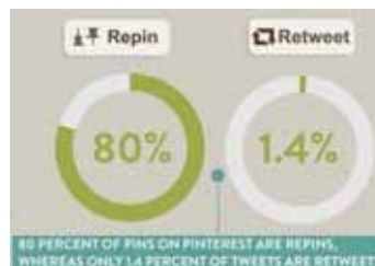
図5 Pinterest の Repin と Twitter の Retweet の割合

Pinterest における引用とは Repin のことである。Pinterest では自分の写真を投稿するのではなく、他のユーザの投稿を Repin することが多い。Repin の割合は全体の投稿の 80% を占めるほどである。Twitter で他者の発言を引用する Retweet の割合は 14% であることから、Repin の割合が高いことがわかる。