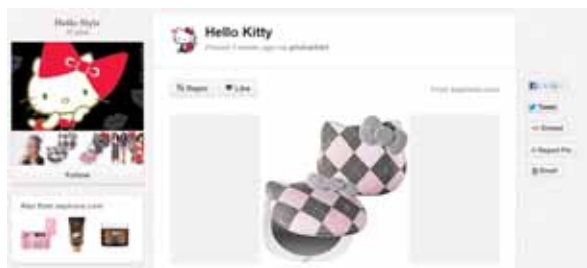
図6 ハローキティのPinterestページ

日本では、サンリオ、資生堂、ユニクロ、楽天市場、ローソンといった数々の企業がPinterestのアカウントを取得している。マーケティングにPinterestを取り入れるとしたら、ファッション、インテリア、観光などと相性が良い。特に利用者に女性が多いことから、女性をターゲットとした商品を扱う企業に適している。サンリオのHello Kittyのフォロワーは6,300人 c を超えており、Pinterestを利用する国内企業の中で上位に位置する。写真で購買意欲を高め、商品の通販サイトへ誘導することができる。