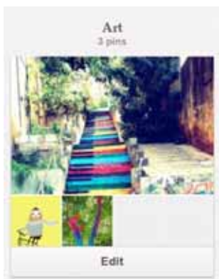
図3 自分のボードに表示された状態

ボードは動物、場所、食べ物など任意のカテゴリに分けることができる。カテゴリ化することで検索した時に目当ての画像を探し易くなる。さらに大きなサイズの写真であっても、サムネイル化された写真が表示されるので、統一され見やすい。その様子が図4である。また、これらの写真は Facebook や Twitter と連動させることが可能である。これにより Pinterest に未登録のユーザにもお気に入りの写真を紹介することができる。