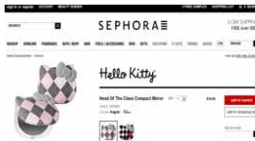
図7 図6の商品をクリックしたとき表示される通販ページ

綺麗でおしゃれな写真には注目が集まるため、写真による商品の宣伝効果は絶大である。サンリオに関わらず、実際に広告を見て購入に至った割合の比較は、Facebookで33%、Pinterestは59%であったという d 。Pinterestはビジネス利用に向いているサービスと言えるだろう。