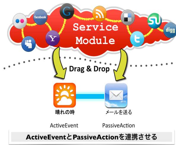
図2：フレームワーク概要

既存のマッシュアップフレームワークは専門的なパラメータ設定など専門知識が必要となりエンドユーザにとって難しい。イベント駆動型モデルでは、すべてイベントを中心にモデルを構築するため、ごく少数のイベントとパラメータのみでモデルを構築することが可能である。本フレームワークではモジュールのモデルを次のように定義する。各モジュールは独立した1つのWebサービスを扱っており、モジュールは以下のインタフェースを提供する。