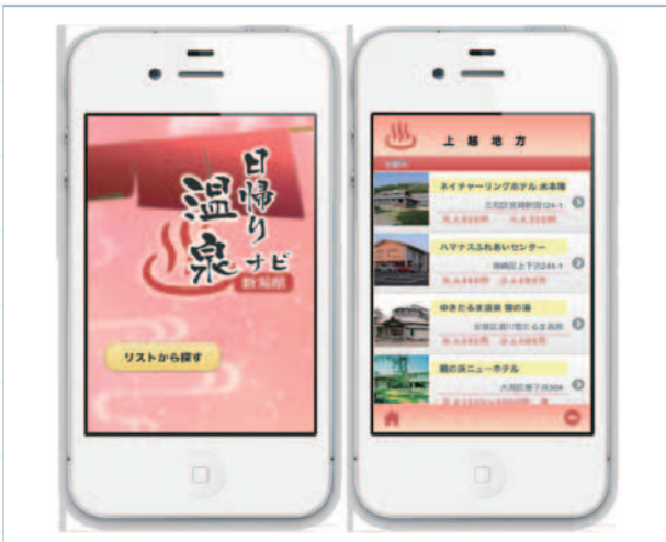
図-3 「にいがた日帰り温泉ナビ」の画面

また、卒業研究をさらに発展させた研究成果の発表を情報処理学会第74回全国大会学生セッションにおいて行うという成果をあげている 2) 。