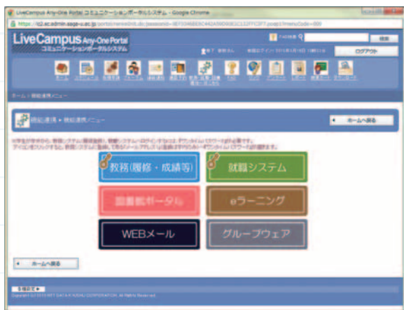
図-2 教務関連ポータルサイト

席の多い学生、履修態度の悪い学生についての情報が、授業担当者から随時投稿される。投稿情報をもとに、他科目の履修状況との相互確認を行い、当該学生への対応を早期に開始する。