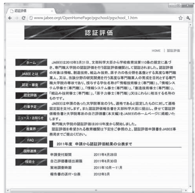
図-2 JABEEの認証評価ページ 2)

IT専門職大学院の訪問調査の過程では、教育上のさまざまな工夫を見学すると同時に、専門職大学院側の考えをヒアリングした。訪問調査は、策定中